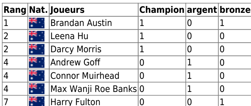
Tableau des Médailles