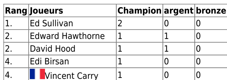
Tableau des Médailles