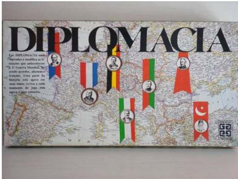
Plateau en 3 parties