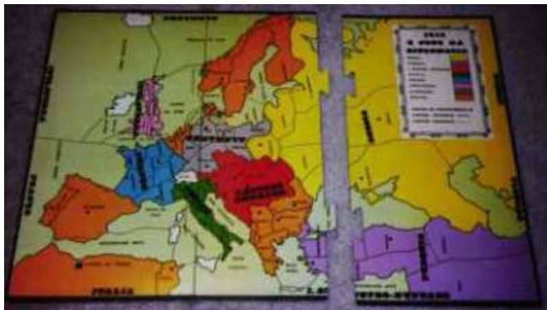
Plateau au final